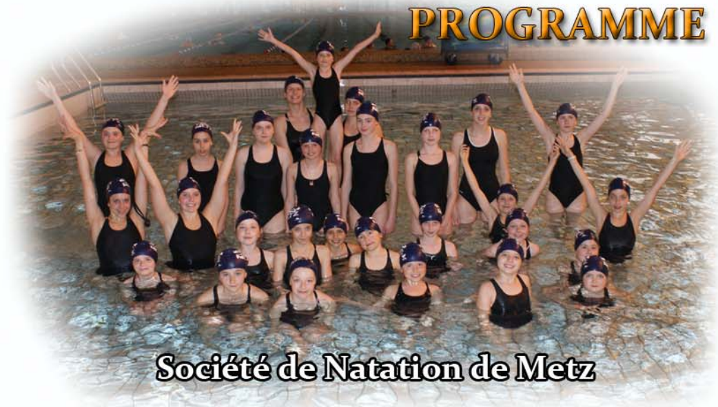
Société de Natation de Metz